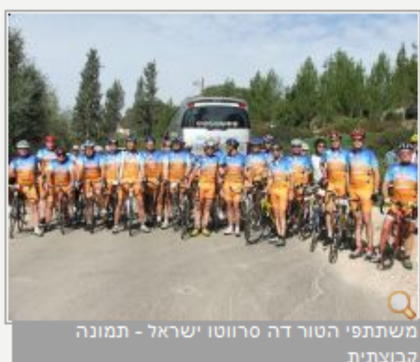
משתתפי הטור דה סרווטו ישראל - תמונה הבוטית

שבועיים חלפו מאז המראו משתתפי הטור סרווטו דה ישראל חזרה לאירופה. אני עוצם את עיני ומנסה לשחזר את שעברתי במהלך המסע המדהים הזה, שהביא ארצה כמה מבכירי ענף האופניים העולמי. מול עיני עולה דמותה של אן - זוגתו לחיים של מצע הטור דה פראנס והבעלים של קבוצת Saxo Bank, ביארן ריס, הנושאת זוג עיניים מעריצות אל עבר בעלה. ביארן עומד זקוף בכניסה לאוטובוס המסע. גבו מופנה אל חלון הנהג ופניו אל היושבים בשעת נסיעה מירוחם למצפה רמון. הדני הגבוה, שמאז פרישתו מרכיבה מקצוענית עלה במשקל, נראה עתה אתלטי ורזה כמו בשנותיו הטובות. ניכר שהוא מתאמן היטב לאחרונה. קמטי העיפיות בזווית עיניו, היוו עדות חיה ליום הרכיבה המפרך שעבר עליו.